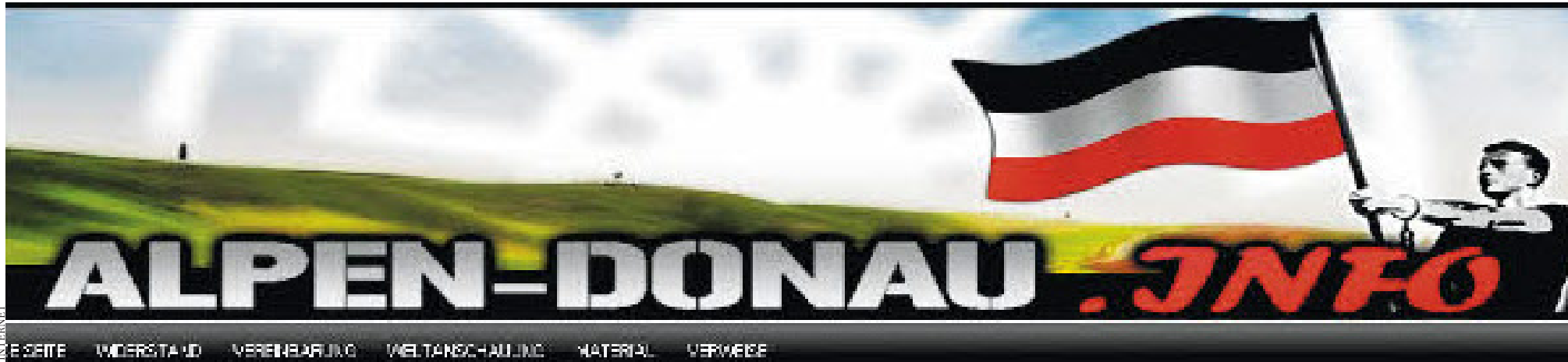
Auf der Nazi-Website „alpen-donau.info“ werden Meinungsträger der Republik und der jüdischen Gemeinde auf das Übelste beschimpft – wegen ihrer modernen Gestaltung ist sie vor allem auch bei Jugendlichen beliebt