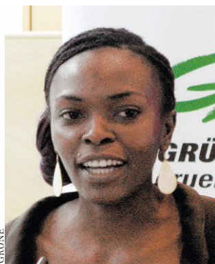
Hartig: Beschimpft als „Negerin“, die nie echte Österreicherin wird

mierte sofort den Verfassungsschutz. „Die in den Formulierungen zum Ausdruck gebrachte extreme Härte und Menschenverachtung war ungewöhnlich – und in der Form hierzulande bis dato