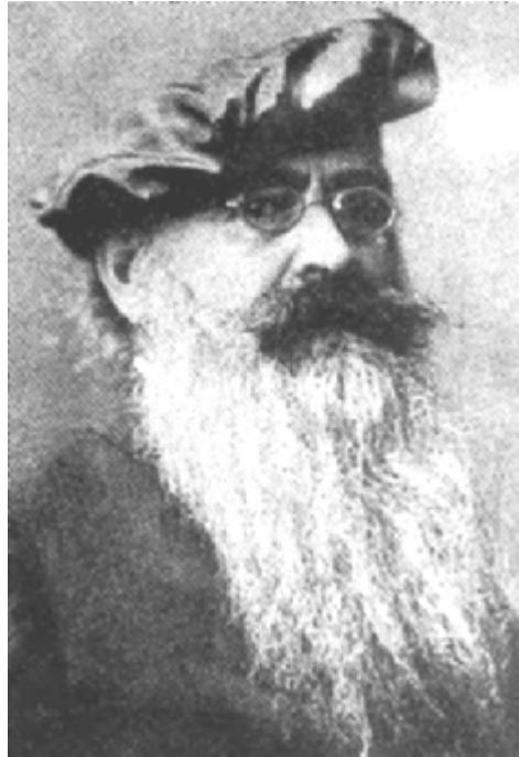
Der Großmeister der armanischen Heerscharen

In der so genannten New-Age-Bewegung der Achtzigerjahre kamen vor allem wieder einmal "Runen" in Mode, wobei immer wieder betont wurde, dass es sich dabei um kein nationalsozialistisches Gedankengut, sondern um urtümliches Wissen handle. Bei genauerer Einsicht ergibt sich allerdings ein wesentlich anderes Bild: Die vorgebliche Urtümlichkeit der Runenesoterik verliert sich dann sehr rasch und man landet bei einem Mann, der mit seinen Ideen den okkulten Untergrund des Nationalsozialismus ganz wesentlich mitgeprägt hat: Guido von List. Nicht umsonst warf man ihm vor, der Aleister Crowley Wiens zu sein. Dieser, den Hemingway den schlimmsten Menschen auf der ganzen Welt nannte, war seinerzeit ein weltberühmter Satanist und schwarzer Magier. Auch List nannte sich selber gern einen "Zauberer". Seine Bücher sollten auf jeden Fall später großen Einfluss auf völkisch-germanische Gruppen wie die berüchtigte "Thule-Gesellschaft" in München und auf Himmler und Hitler haben.