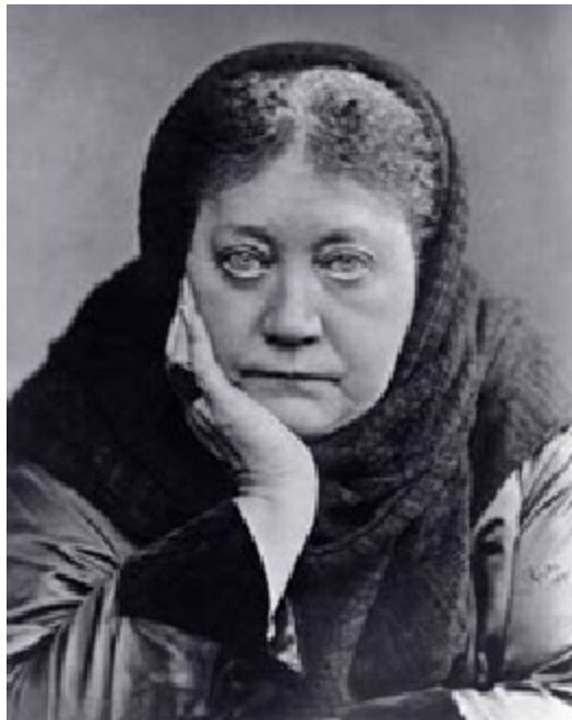
Helena Petrowna Blavatsky