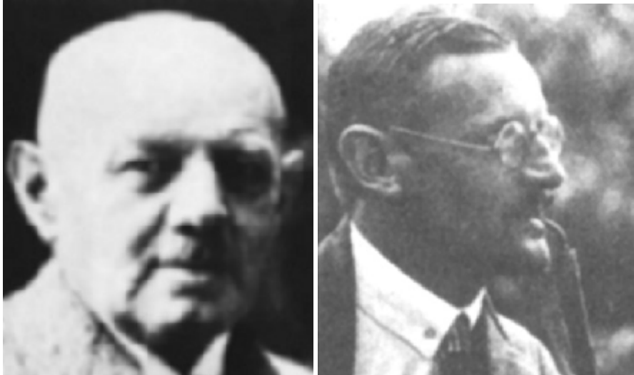
Hitlers Mentor in München, Dietrich Eckart (1868-1923) - Anton Drexler (1884-1942), der Gründer der „Deutschen Arbeiterpartei“, aus der Hitler seine NSDAP aufbaute

den Räumen der Thule-Gesellschaft einen "National-sozialistischen Deutschen Arbeiterverein", parallel zur "Deutschen Arbeiter-Partei", deren Vorsitzender ebenfalls Anton Drexler heißt.