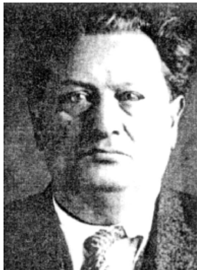
Rudolf von Sebottendorf

Im Jahr 1917 taucht in München ein ziemlich vermöglicher Abenteurer namens Rudolf Freiherr von Sebottendorf auf, obwohl 1875 als Adam Alfred Rudolf Glauer geboren, behauptet er, adeliger Herkunft zu sein. Er ist türkischer Staatsbürger und schweigt sich über die Herkunft seines Vermögens aus. Der angebliche Freiherr gilt als exzellenter Kenner des Islam, der Freimaurer, der Rosenkreuzer und der Alchimie. Er bewundert die antisemitischen Tiraden Guido von Lists und hält Vorträge über esoterische Themen.